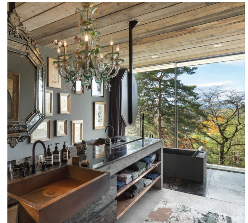
Des salles de bains luxueuses.

de formes et de couleurs différentes rappelant des miroirs ou encore une impressionnante table de salle à manger. Celle-ci a été réalisée dans le plus vieil arbre du monde, âgé de 46 000 ans, découvert au Brésil lors d'un chantier de construction. Les rampes d'escaliers historiques ou encore les salles de bains revêtues de marbre ou de cuivre participent au raffinement de la maison de même que la cuisine sur mesure, conçue par le cuisiniste français Rorgue, entreprise plus que centenaire connue pour réaliser les cuisines des chefs étoilés.