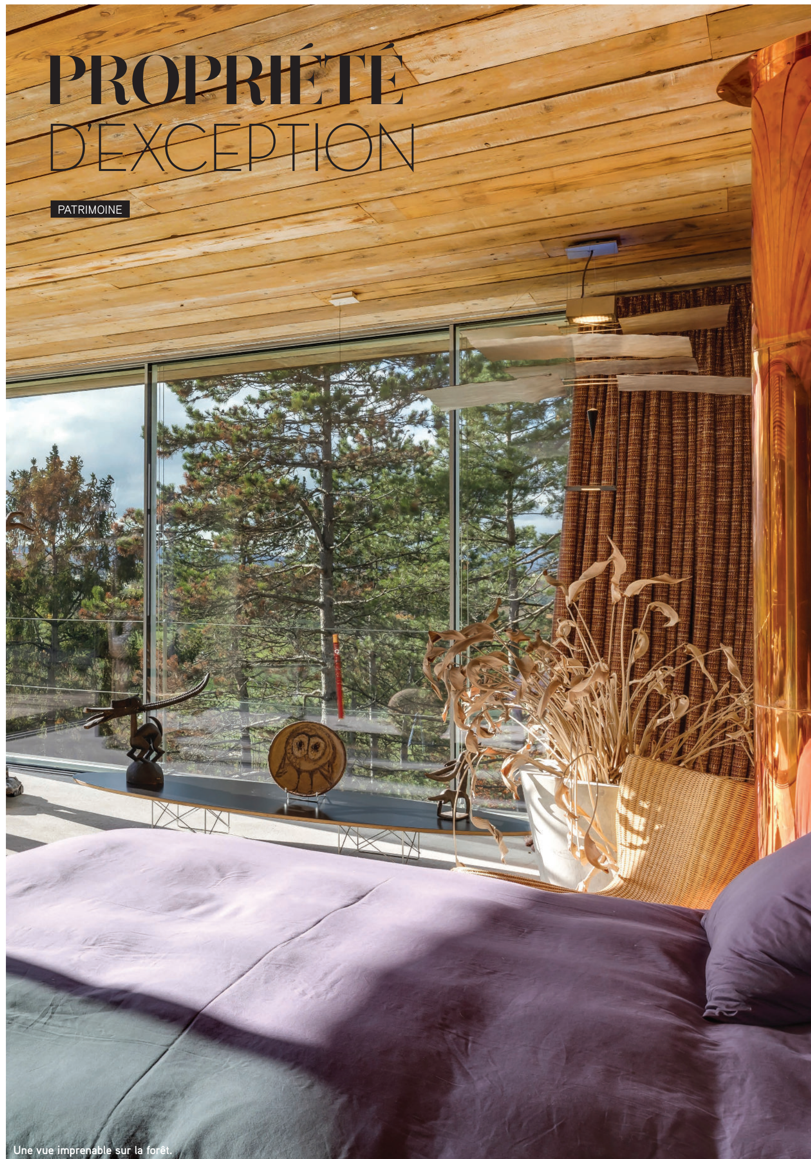
Une vue imprenable sur la forêt.